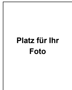
Foto postalisch oder per E-Mail an info@afwn.de

Nachname _____ ggf. Geburtsname _____ Vorname _____ Abschlußsemester _____ Studiengang _____ (inkl. akad. Grad) Geburtsdatum _____