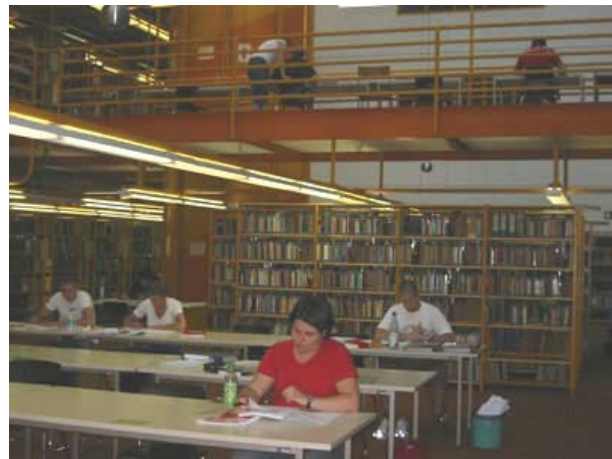
Studenten im hinteren Lesesaal der Bibliothek